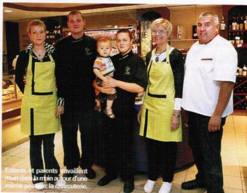
Enfants et parents travaillent main dans la main autour d'une même passion: la charcuterie.